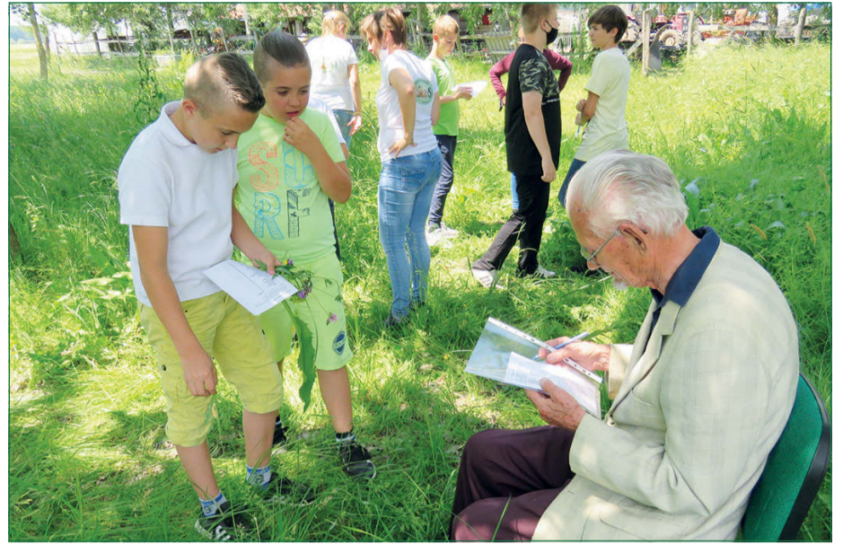
A Bölcs baglyok a terepi növényismeret közben.

A végső fordulót jelentő döntőt idén már alkalmunk nyílt „élőben” megrendezni, melynek a Szamárháti Látogatóközpont